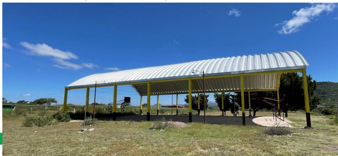
construcción de techado de cancha de usos múltiples en la unidad deportiva de la sección segunda, chila, puebla.