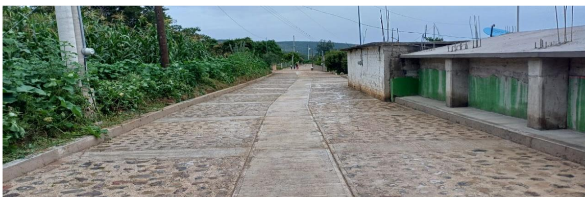
Pavimentación con empedrado de la calle el pirul en la localidad de las sidras, chila, puebla.